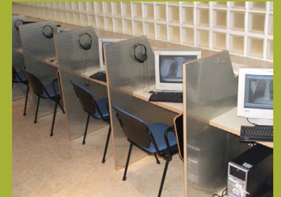
Locutorios de internet