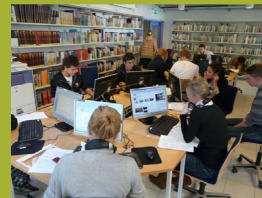
Bibliotecas y videoclubs