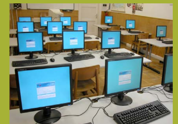
Centros de formación e idiomas