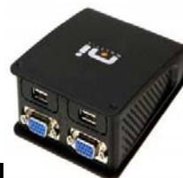
Adaptador USB para VGA/DVI