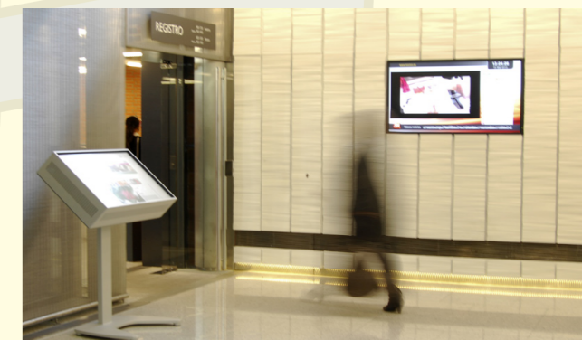
Sistema de marketing dinámico instalado por Bechtle y RPS Audiovisuales en la sede del Ministerio de Ciencia e Innovación de Madrid