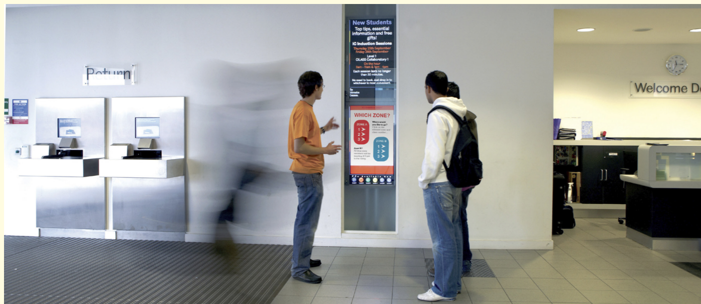
El marketing interactivo en centros educativos informa de dónde se encuentra un aula o zona, cuáles son los horarios de trenes y autobuses próximos, horarios de clases y exámenes, documentación necesaria para cualquier gestión...

El Digital Signage no es un monitor de información. En español se traduce con varias denominaciones: cartelería digital, marketing dinámico, señalización digital... todos estos términos para designar esta nueva forma de comunicar. Su enorme potencial permite informar en tiempo real, comunicar cualquier mensaje o contenido, publicitar productos o marcas, entretener o mostrar las posibilidades de un servicio.