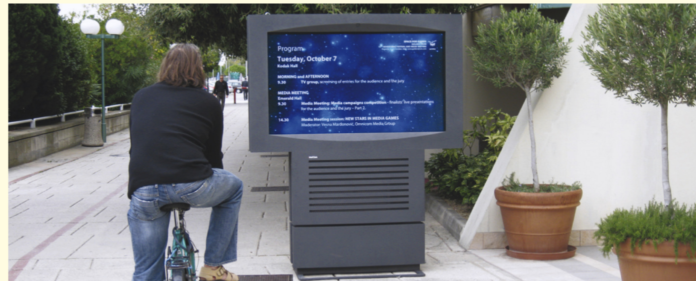
El sistema IMotion está fabricado expresamente para exteriores. Sus tótems pueden ser horizontales o verticales, con pantalla por los dos lados, interactivos y naturalmente, todos son antivandálicos y soportan las inclemencias más extremas de cualquier clima.

anular la programación realizada para comunicar avisos urgentes. Una solución óptima para el público específico de los centros comerciales es URBAN VIEW . Está basado en Onelan y dispone de distintas alternativas, como tótems con pantallas interactivas por ambos lados, para que el usuario pueda encontrar fácilmente la tienda o el producto que busca a través de un plano interactivo del centro. Esta información puede alternarse con mensajes publicitarios, lo que hace del Digital Signage un formato de rentabilidad creciente. Los responsables de marketing conocen muy bien la eficacia de un consejo en el momento de compra.