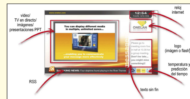
El software creado por Onelan permite dividir la pantalla en innumerables zonas con distintos contenidos