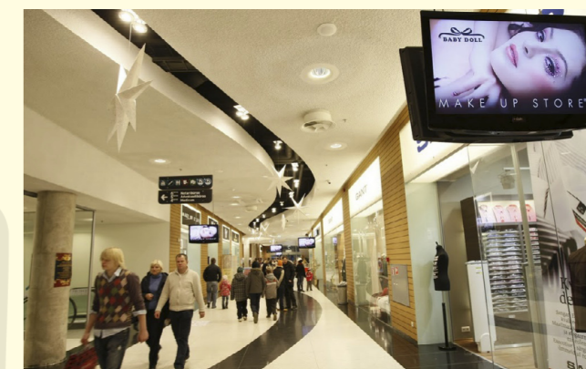
Los centros comerciales de Europa y, poco a poco de España, han descubierto en el Digital Signage una alta rentabilidad y eficacia

El marketing dinámico tiene un avance imparable. En RPS Audio-visuales hemos estudiado muchos sistemas de marketing dinámico sabemos que Onelan es la alternativa más segura y avanzada, que garantiza al cliente una total estabilidad y la máxima facilidad para la renovación de contenidos de todos los formatos.