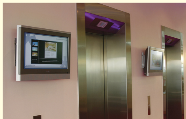
Las cadenas hoteleras han incorporado progresivamente pantallas con marketing interactivo

más completas que otras. La marca inglesa Onelan ha apostado siempre por la simplificación y la fiabilidad del sistema, optando por Linux. Con otros programas más complejos de utilizar, los mismos contenidos permanecían meses, ya que nadie sabía como cambiarlos. Con Onelan resulta tan sencillo que cualquiera puede hacerlo, por muy inexperto que sea. La pantalla se puede dividir en un número ilimitado de zonas y trabajar por capas y transparencias, posibilitando diseños muy avanzados y creativos. Pero, a su vez, el sistema tiene de una gran colección de plantillas ya realizadas y disponibles por red, en las que sólo tiene que añadir los contenidos que quiera incluir. Con Onelan sólo realiza un único pago, ya que las actualizaciones son on-line y gratuitas. Dispone además, de distintas funciones avanzadas y muy útiles, como la capacidad de